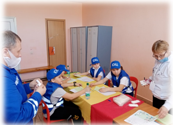
Районный конкурс отрядовых инспекторов движения

В рамках акции недели БДД участники отряда «Дорожный патруль» раздали учащимся начальных классов памятки «Юного пешехода»