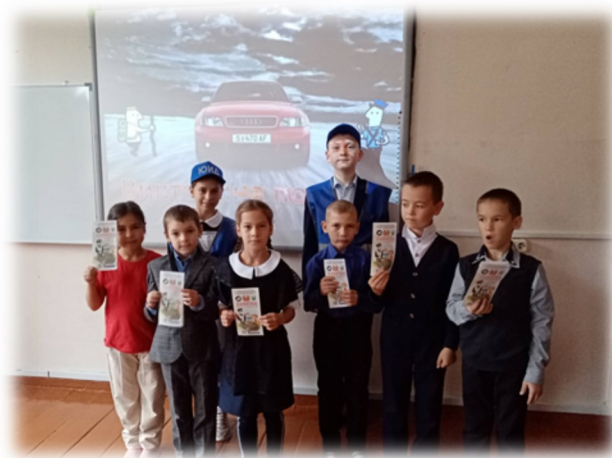
Выступление отряда перед школой на знание правил дорожного движения

В рамках акции недели БДД участники отряда «Дорожный патруль» раздали учащимся начальных классов памятки «Юного пешехода»